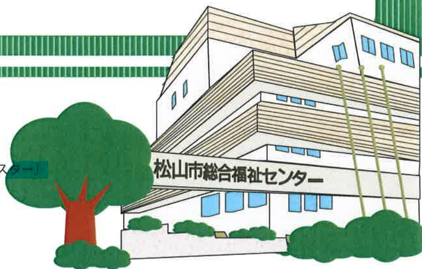
松山市総合福祉センター