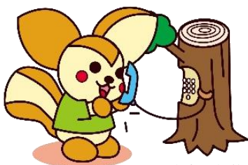
松山市自殺対策推進キャラクター リスにん