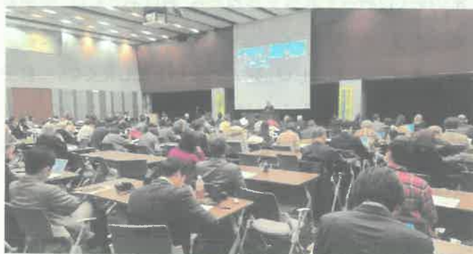
(参議院議員会館の様子)