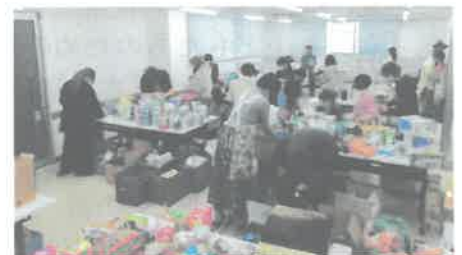
2023年10月のスペシャルボックス