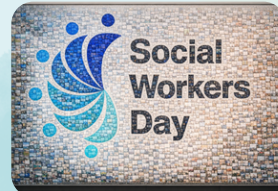
この写真はイメージです

あなたの幸せとみんなの幸せが一つなる時、どのような作品が生まれるのでしょうか？ 家族・風景・ペット・食事・趣味・大切な瞬間など、「あなたの幸せ」をご応募ください。